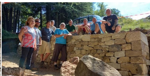
Chantier école mur de soutènement (calcaire et basalte) Avec la mairie de Privas (07)