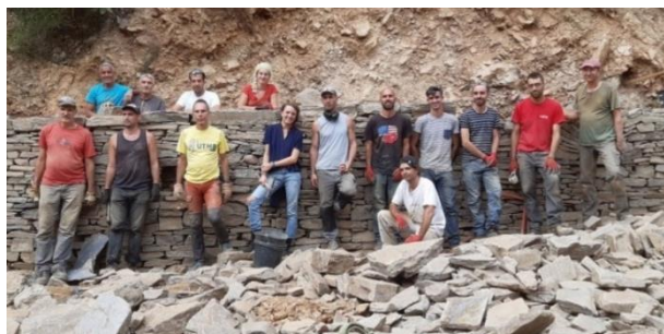
Chantier école mur de soutènement (en schiste) Avec la mairie de Ventalon en Cévennes (48)