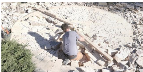
Chantier école Calade (en calcaire) Avec la mairie de Collias (30)