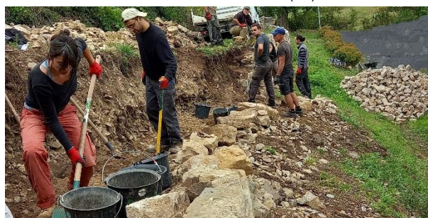
Chantier école mur de soutènement (en calcaire) Avec la mairie de Mostuéjols (12)