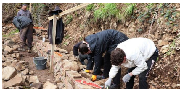
Chantier école mur de soutènement (en basalte) Avec la mairie de Courgoul (63)