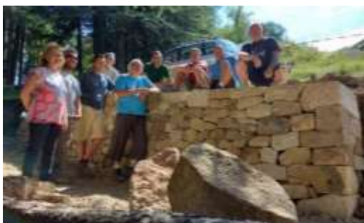
Chantier-école mur de soutènement (en calcaire et basalte) Avec la mairie de Privas (07)