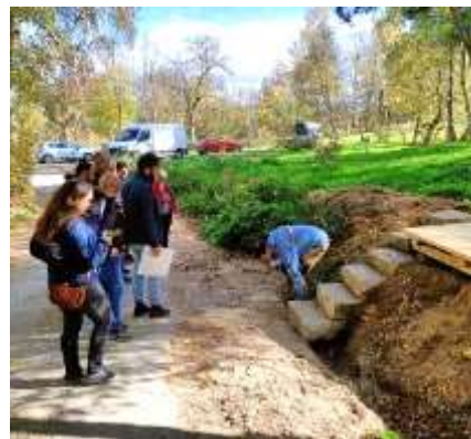
Expertise création de mobiliser design bois-pierre sèche

Visite technique et accompagnement à l'écriture du CCTP pour un marché de restauration d'un mur de soutènement routier, Peyreleau (Aveyron) - pour le PNR des Grands Causses et le Conseil Départemental de l'Aveyron