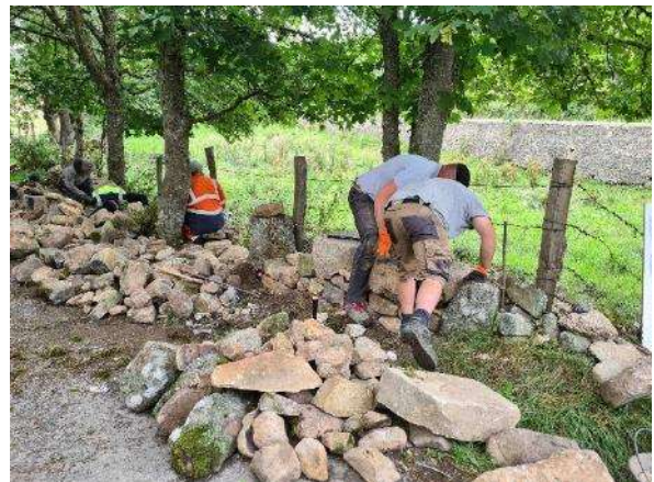
Action de sensibilisation à destination des élèves de l'EREA Lattre de Tassigny, des agents territoriaux et des élus menée en partenariat avec le PNR Aubrac

(Plus d'infos : https://www.parc-naturel-aubrac.fr/actualites/a-saint-chely-daubrac-renover-le-saint-jacques-et-apprendre-la-pierre-seche/ )