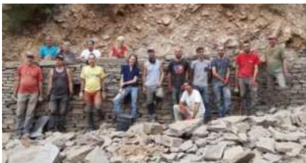
Chantier-école mur de soutènement (en schiste) Avec la mairie de Ventalon en Cévennes (48)