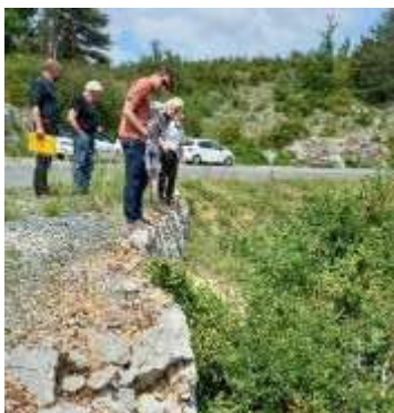
Expertise restauration soutènement routier

Tous types d'ouvrages en pierre sèche sont concernés (patrimoine vernaculaire en pierre sèche, murs de soutènement routiers, calades, ponts, ensembles paysagers...).