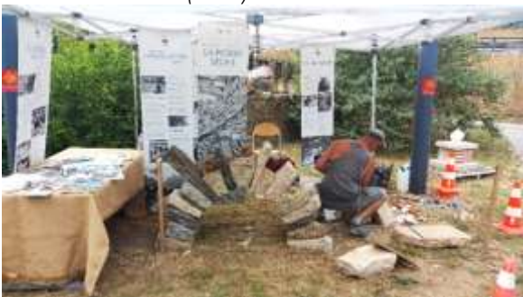
Animation d'un stand à l'occasion du salon Maïada au CFA BTP d'Alès (Gard)

L'association ABPS dispose d'une exposition itinérante sur la technique et la filière pierre sèche. L'exposition peut être empruntée à la demande afin de créer un moment d'échanges, informer, et sensibiliser à la pierre sèche sur les territoires.