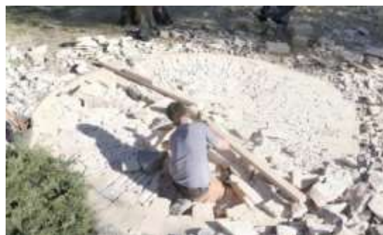
Chantier-école Calade (en calcaire) Avec la mairie de Collias (30)